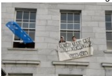
Activisten van Sinn Féin bezetten het hoofdkwartier van regeringspartij Fianna Fáil: "EU/IMF take notice: Ireland is not for sale".

De Ierse regering van eerste minister Brian Ó Comhain (Cowen) kondigde op 24 november een plan van zware besparingen aan (ondertussen overigens al het vierde sinds de crisis uitbrak): nog eens 10 miljard euro aan rechtstreekse besparingen en 5 miljard aan extra belastingsinkomsten. Dit treft vele tienduizenden Ieren rechtstreeks in hun werkzekerheid en vele miljoenen op hun bankrekening. 'Onze' reguliere media blijven de Europese interventie voorstellen als een 'reddingsplan' voor Ierland, maar lang niet iedereen op het eiland ziet dat zo. Verzet tegen deze 'reddingsboei' is sterk aanwezig en zal ongetwijfeld nog toenemen als de zogenaamde 'austerity measures' hun effect doen gelden.