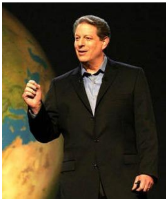
Al Gore maakte een hype van het 'groene' kapitalisme.

De auteurs stellen zich de vraag naar de mogelijkheden van een groen kapitalisme, gesymboliseerd in Al Gore , de voormalige vice - president van de VSA. De auteurs spreken over de Green Deal . Het is een verwijzing naar de New Deal van VSA- president Franklin Roosevelt in de jaren dertig van vorige eeuw waar de loonstijgingen en de uitbouw van de sociale zekerheid in de VS in zekere zin de motor waren van een nieuwe groeidynamiek van het kapitaal. Dat lijkt volgens de auteurs de inzet te zijn voor de “groene economie”. “Waar in de 20 e eeuw werd getracht het verzet van de arbeidersbeweging met hun looneisen aan te wenden voor een nieuwe boost van kapitaalsaccumulatie, wordt nu gepoogd de ecologische strijd die de facto ingaat tegen de groeilogica van het kapitaal, om te draaien ten voordele van een nieuw regime van kapitaalsaccumulatie” . (blz. 121)