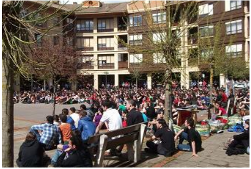
Enkele duizenden Baskische jongeren en internationale delegaties kwamen bijeen in Urduña voor een bijeenkomst van linkse soevereïnisten.