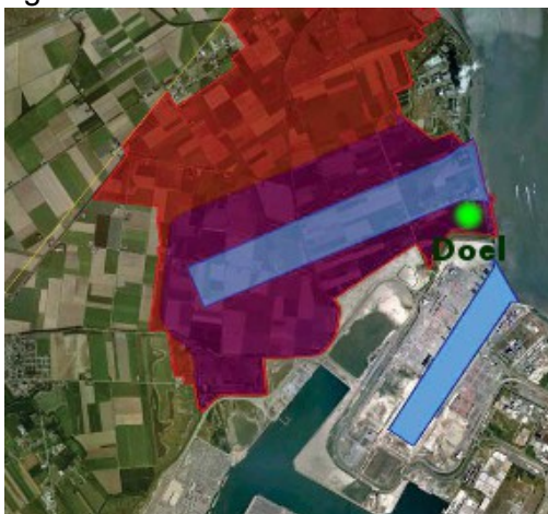
Het geplande Saeftinghedok (paars), de "natuurcompensatie" (rood) en Doel dorp (groen)

Op 18 juli, bereikten de actiecomités die tegen het Saeftinghedok en tegen het BAM-tracé van de zogenaamde Oosterweelverbinding strijden een opmerkelijk akkoord met de Vlaamse Regering. Doel2020, Erfgoedgemeenschap Doel & Polder, Straten-Generaal, Ademloos en Ringland konden afdwingen dat het voorheen "voldongen" project van een nieuw dok in Doel wordt teruggeschroefd naar een "complex project" waarbij eventuele alternatieven onderzocht kunnen worden. Al blijft waakzaamheid geboden.