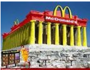
Een Grieks “reddingsplan”

De 'hulp' aan Griekenland die de trojka wil geven in ruil voor de harde neoliberale hervormingen kan eigenlijk nog het best omschreven worden als een Trojaans paard, om het in Griekse terminologie uit te drukken. Het grootste deel van dat geld zou immers niet naar Griekenland zelf gaan, maar naar de Europese banksector. In de publieke opinie wordt het vaak voorgesteld alsof de crisis de schuld is van de corrupte en luie Grieken. Het klopt dat er in Griekenland een grote mate van corruptie is - een probleem waar zeker iets aan gedaan moet worden - maar daar gaat het eigenlijk niet om in deze crisis. De aanwezigheid van corruptiepraktijken is slechts het excuus om de Europese bevolking niet te argwanend te laten worden. In feite is Griekenland niets anders dan een 'ground zero', het proefterrein van het nieuwe Europa dat de politieke en financiële elite heeft uitgedokterd en dat verder gaat dan waar Margaret Thatcher ooit van kon dromen. De agenda van ECB, EU en IMF is niet die van 'financiële stabiliteit': mocht dat zo zijn dan hadden ze de banksector zelf aangepakt. Net het omgekeerde is het geval: de banksector profiteert mateloos van instabiliteit. Zware besparingen en heel volatiele markten zijn ideaal voor speculatie. De handelspraktijk van de banksector bestaat er in zeer grote risico's te nemen - zonder zelf het risico te dragen; dat doet de gemeenschap.